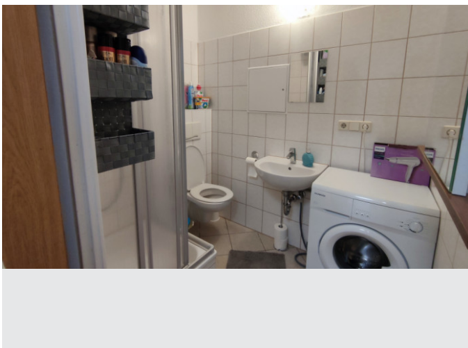
Bad mit Dusche und WM-Anschluss