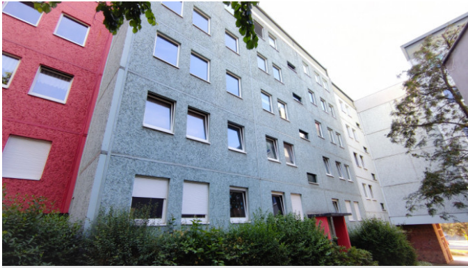
Ziegelberg 15, 13

Wohnung, 3 Zimmer - Ziegelberg 17, 07545 Gera Stadtmitte