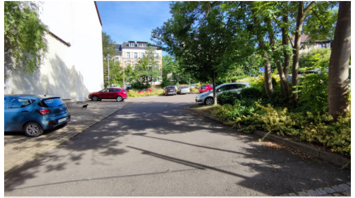
Parkplatz am Haus