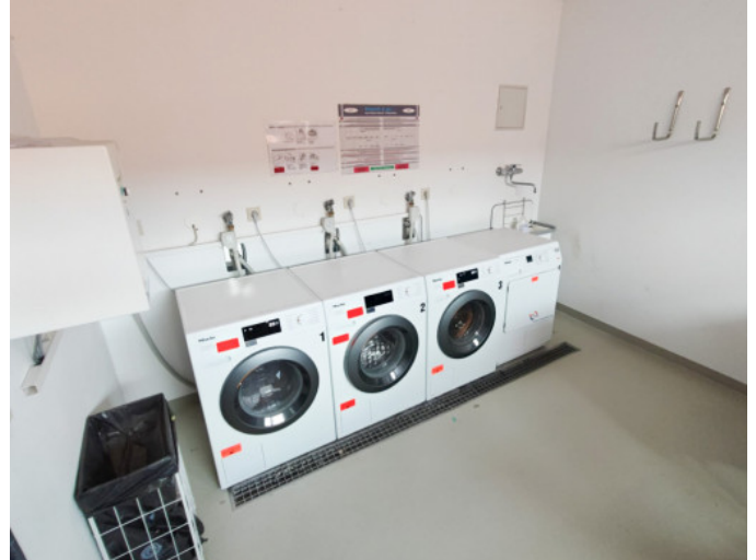
HWR mit Waschmaschinen und Trockner