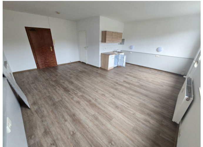
Wohn-/Schlafzimmer mit offener Küche