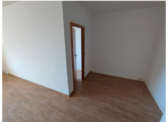
kleine Essecke und Zugang zum Kinderzimmer