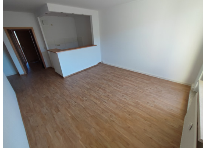
Wohnzimmer mit Küchenwürfel