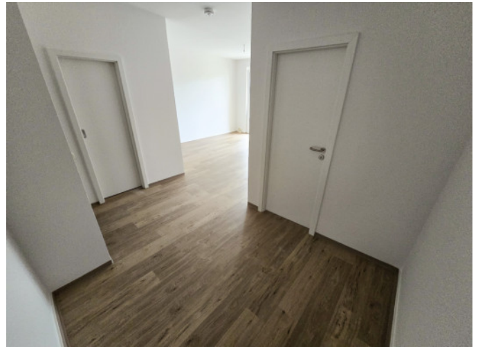
Essecke mit Blick zu Küche, Wohnzimmer und Kinderzimmer